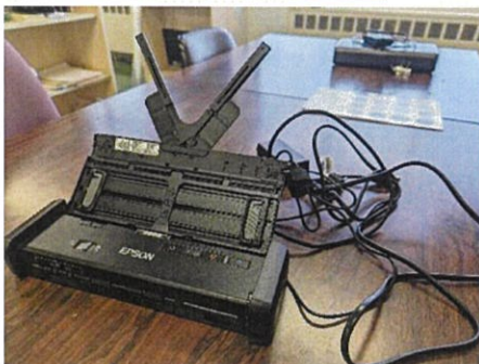
左から 裁断機・課題本（一部）・実際の読書会の様子・スキャナー