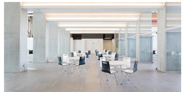
コミュニケーションスペース(1F)

1924年、自動車運転技能教授所という「実学の学び舎」を母体に本法人は誕生しました。当時の法人創立を象徴するのが、短期大学部が所有する「T型フォード」です。大衆車の原点とも言えるT型フォードと、E棟の完成に伴い、北海道日産自動車(株)より寄贈された「LEAF」は、次世代の電気自動車として注目を集めており、それぞれが時代のシンボル。T型フォードからLEAFへと時代が刻まれてきたように、新たな未来に踏み出す私たちの姿を2台の自動車に重ね、ご来館いただく方にいつでもご覧いただけるようHUS PLAZAに展示しています。