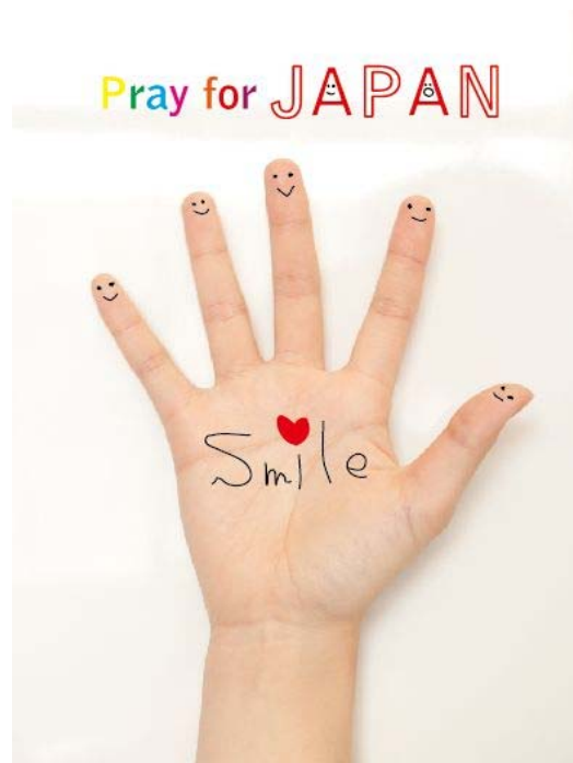
ポ ス タ ー