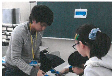
写真 3.工作教室の様子 1