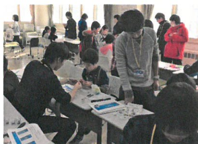
写真 4.工作教室の様子 2