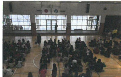
写真 1.開会式の様子

今回同窓会からご支援いただき、無事にサイエンスフェスティバル 2016 に参加することができました。メンバー一同、心より感謝申し上げます。